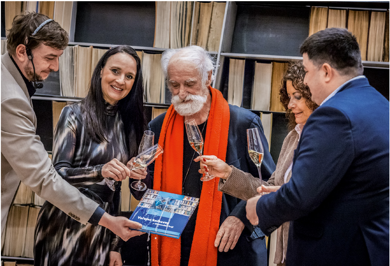
Jednou z prvních velkých akcí roku 2025 bylo zahájení výstavy spojené s představením publikace Veřejné knihovny v Olomouckém kraji .