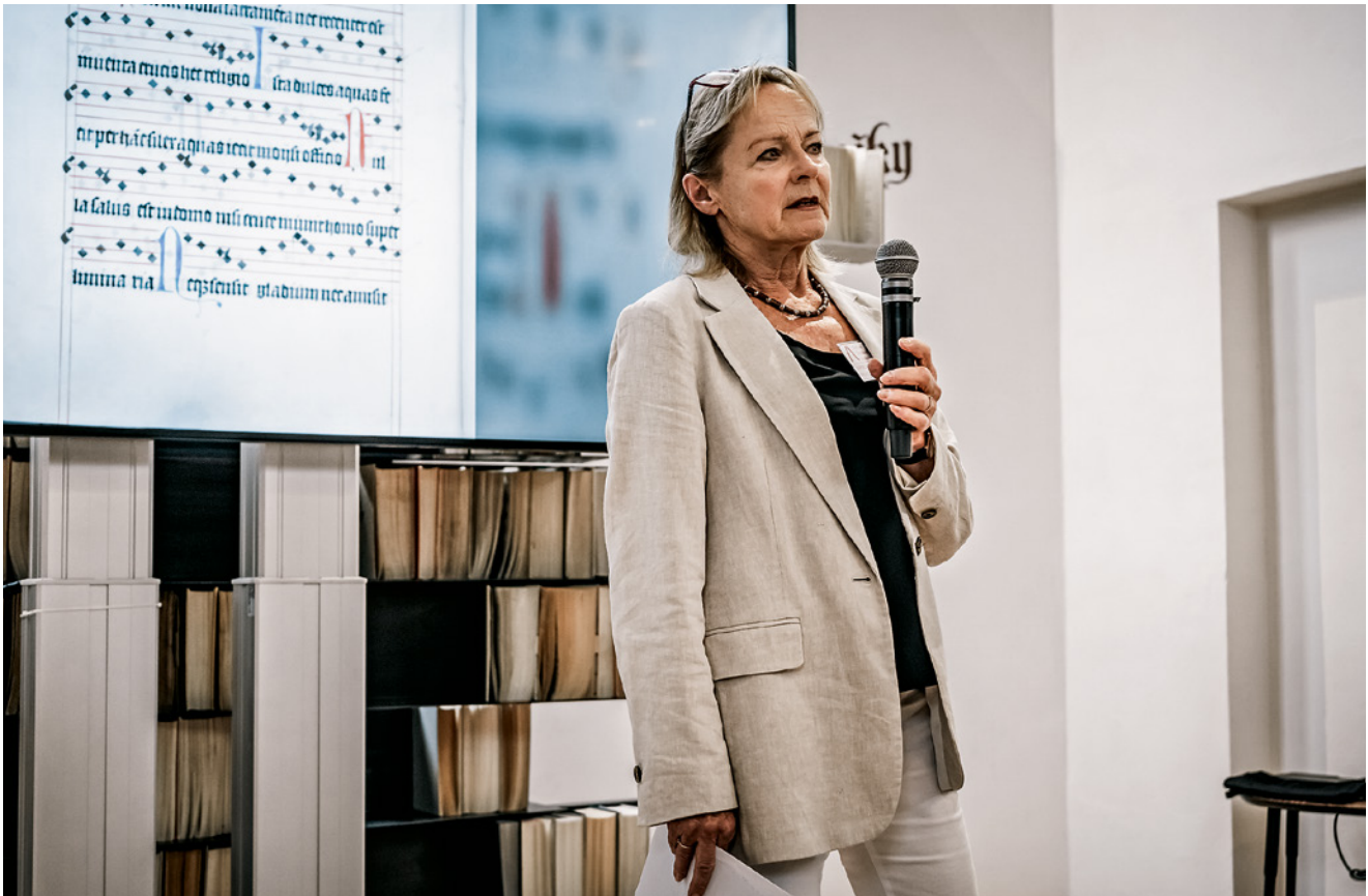
Od června do září 2025 probíhaly komentované prohlídky Červeného kostela, financované z dotace SMOI.