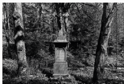
Prokletí Lesního mlýna