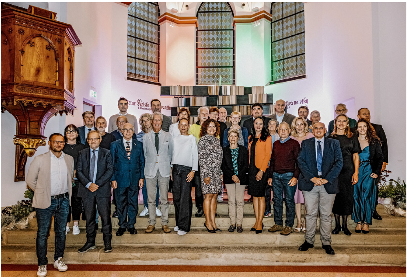
Na vernisáži výstavy Česko-italské přátelství z Velké války přivítala VKOL také početnou delegaci z Tridentstva v Itálii.