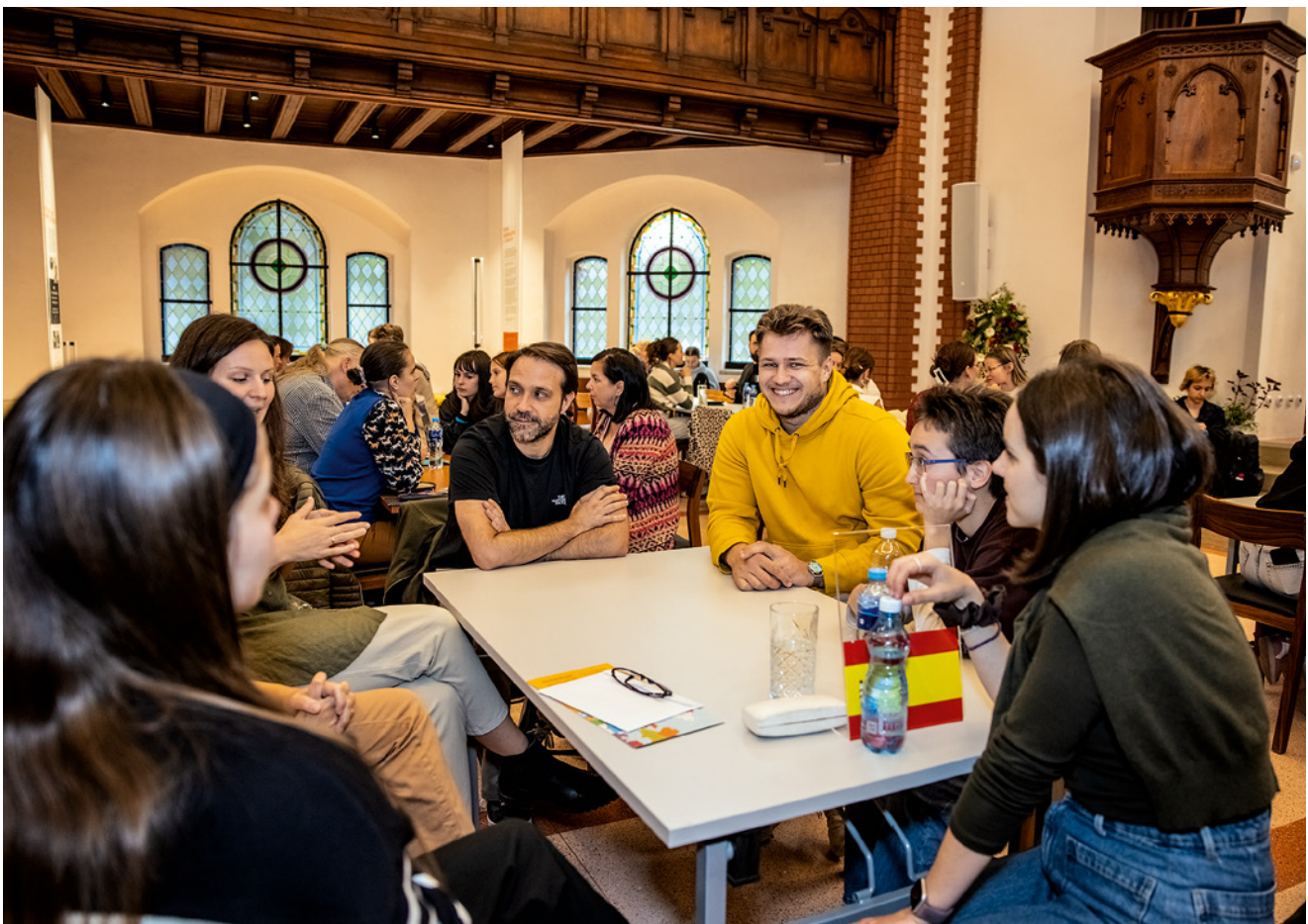
Září patří tradičním akcím VKOL. Dny evropského dědictví přinesly nezapomenutelný zážitek – v podobě koncertu zazněl výběr chorálních zpěvů z Gradálu louckého v podání Svatomichalské gregoriánské scholy z Brna (nahore). Při 11. ročníku Speak-Datingu si zájemci vyzkoušeli konverzaci ve více než 20 různých jazycích.