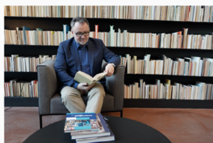
Spisovatel Michal Sýkora