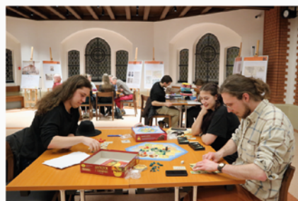
Káva a deskovky