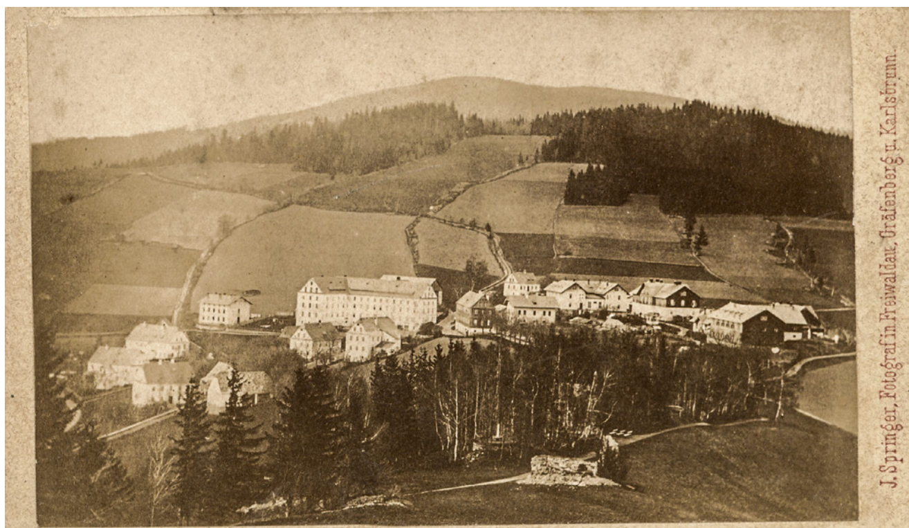
Gräfenberk. Freiwaldau: J. Springer [okolo 1865]. Jeden z nejstarších fotografických pohledů na Gräfenberk.

Sbírka pohlednic, jako jedna z akvizičních priorit, se díky nákupům od dvou soukromých sběratelů opět výrazně rozšířila z velké části o ucelené soubory převážně z Olomouckého a Moravskoslezského kraje (dominují Jeseníky). Mezi mnoha vzácnými kusy se nachází i pohled na Gräfenberk přibližně z roku 1865.