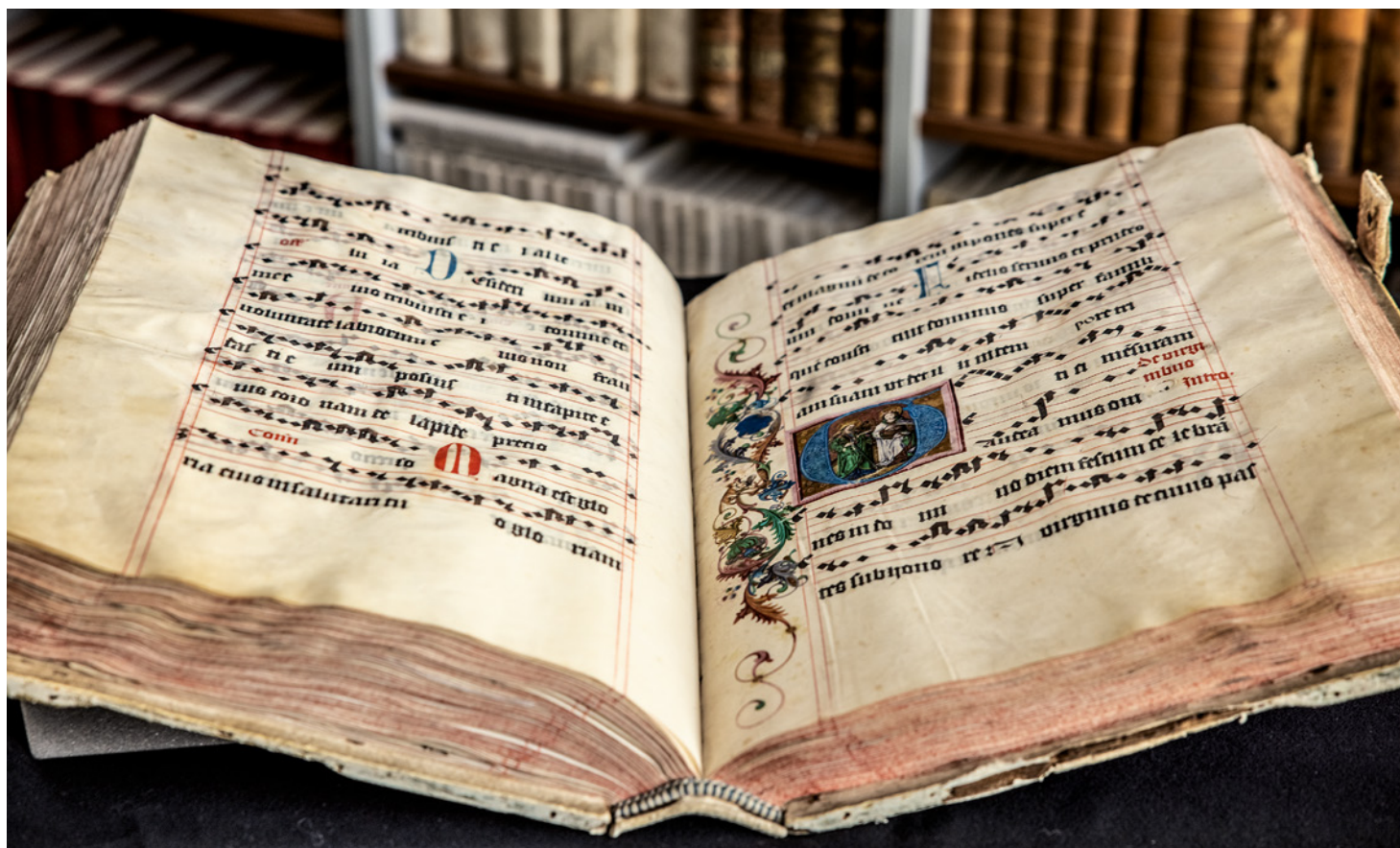
Jeden z nejcennějších rukopisů VKOL - Graduál loucký z roku 1499. Tato kulturní památka byla mimořádně vystavena během Dnů evropského dědictví od 8. do 14. září loňského roku.