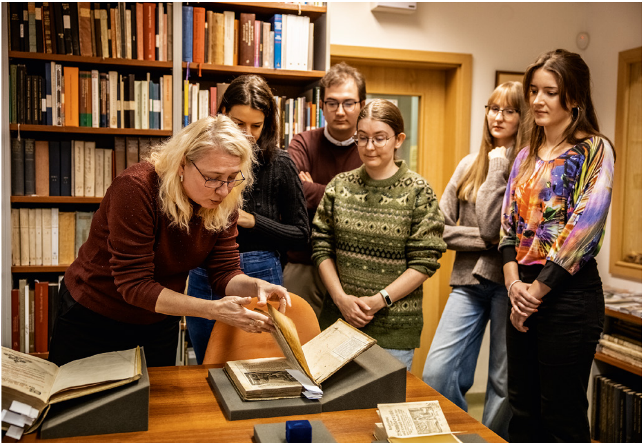
Exkurze ve studovně historických fondů jsou oblíbené u žáků a studentů všech stupňů škol.