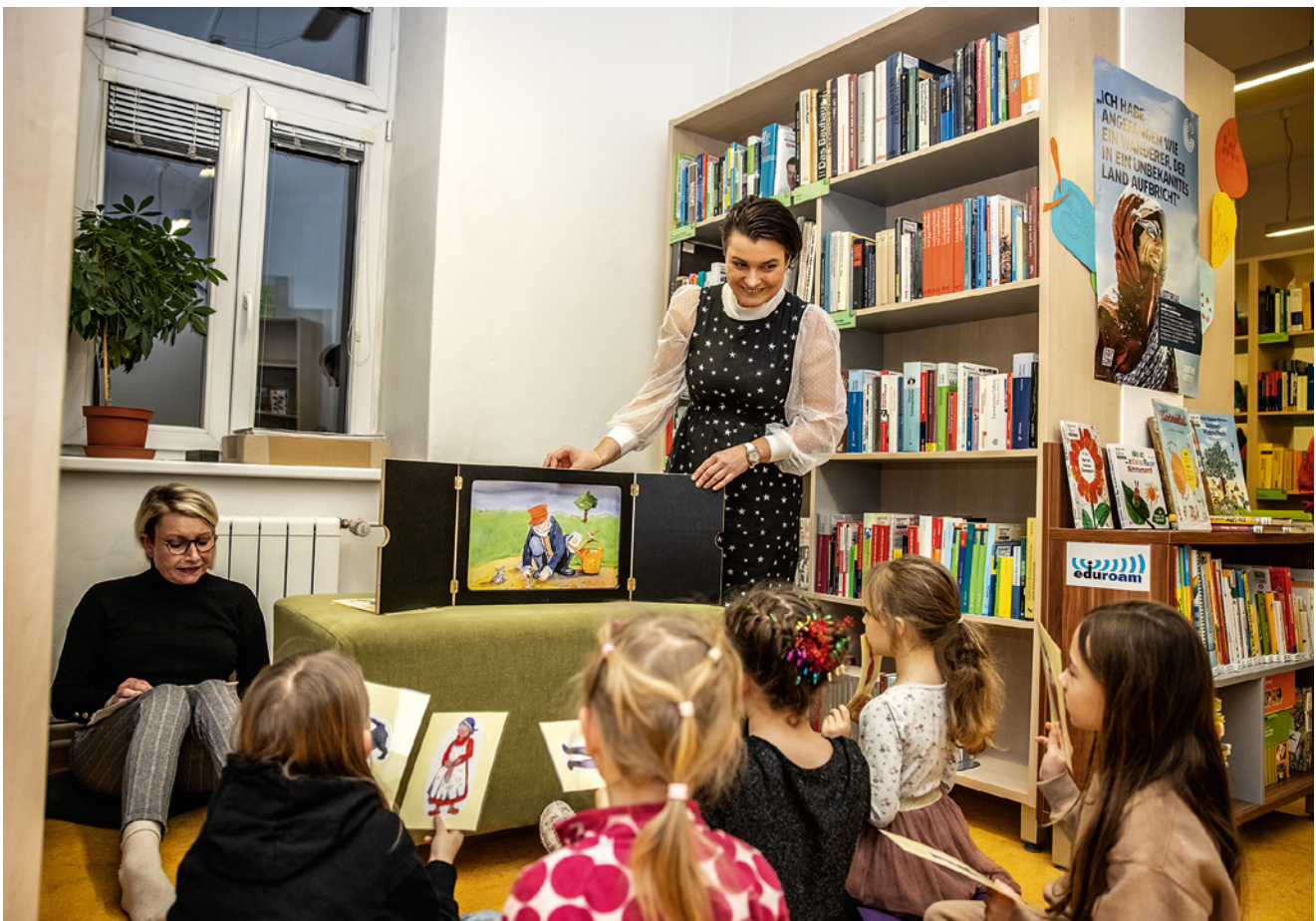
Kinderklub, určený pro děti od 4 let, zajišťuje Centrum pro výuku rané němčiny.