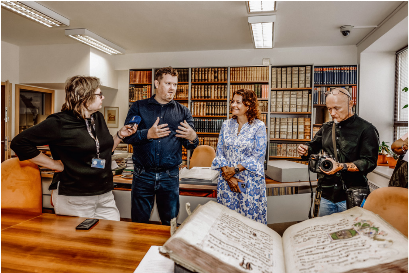
Tiskové konference a setkání s novináři se konaly zejména při významných událostech, například při vystavení Gradálu louckého .