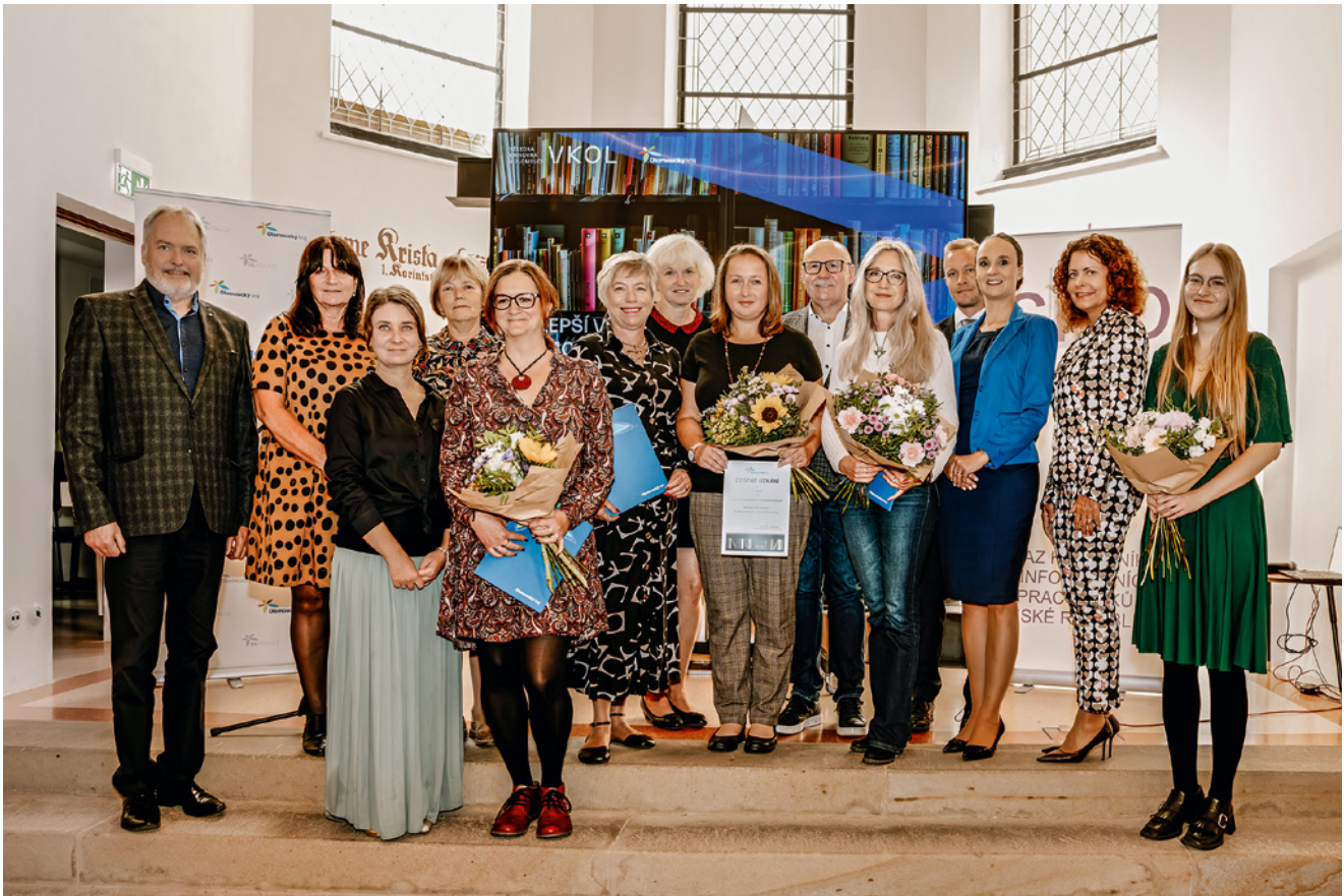
Vítězky soutěže Nejlepší venkovský knihovnicka Olomouckého kraje za rok 2025.